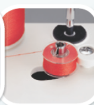
sprzęgłowy system nawijania nici