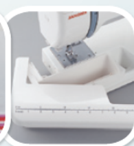
zdejmowany stół - wolne ramię