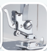
zatraskowe mocowanie stopki