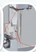
wygodny nawlekc igły