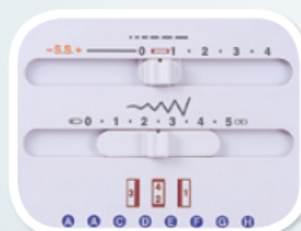
suwak płynnej regulacji długości i szerokości ściegów